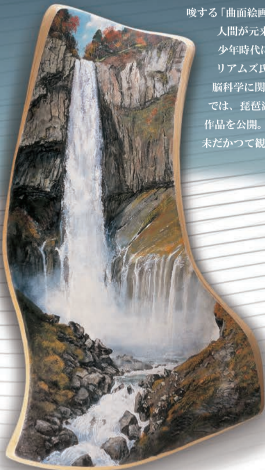
「華厳晩秋」 2011 年 100×184 (cm)

来日 40 年を迎える画家ブライアン・ウィリアムズ氏 (1950-) は、山あいの集落、比叡山の鬱蒼とした木立をぬけて開ける琵琶湖の大パノラマ、穏やかな波がよせては返し葎などの植物が複雑に絡み合い一体をなす水際といった日本の自然美を描いた絵画作品を通して、人間が自然と調和して営みが続けていた頃の、取り戻すべき「のぞましい」景観を提案してきました。2007 年以降は、新しい絵画の可能性を示唆する「曲面絵画」を考案し、自然に包まれる感覚を内包しながら平面の制約から解放された空間の展開と、人間が元来より備えている広角な視野にかなった絵画の表現を目指し創作活動を続けています。少年時代には南米チリの海に潜りさまざまな貝殻を収集・分類するなど研究者的な素養を持つウィリアムズ氏は、創作的な思考だけでなく論理的な思考を併せ持ち、人間の眼球や「球体」の視野、脳科学に関する文献をつぶさに調べ持論の正しさを確認する作業も並行して行ってきました。本展では、琵琶湖はもとより、九州や四国を中心とした日本各地の風景、海外の自然や文化遺産を描いた作品を公開。特に 3メートルを超える作品の一部は展示会場以外の館内空間にて展示いたします。未だかつて見たことのない「曲面絵画」の誕生と、その広がりをお楽しみください。