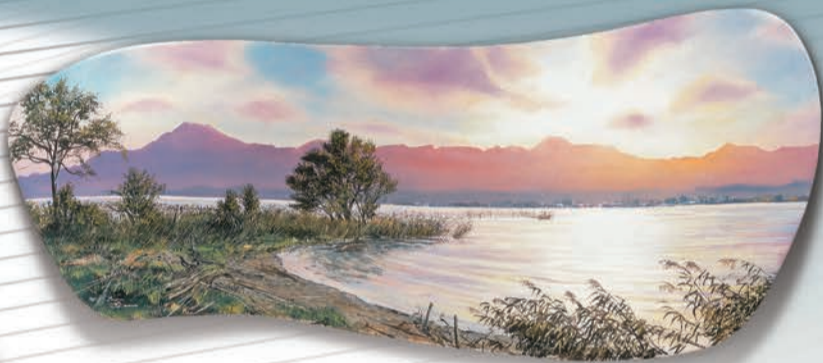
「比叡山 輝く夕」 2011 年 129×54 (cm)