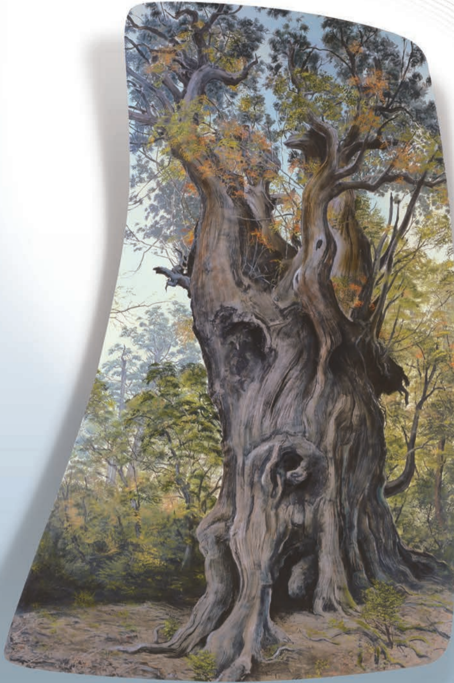
「屋久の縄文杉」 2011年 237 x 346 (cm)